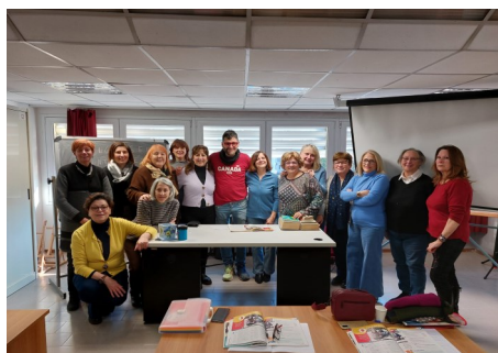
SPAGNOLO 2° LIVELLO