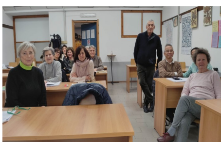
FRANCESE 2° LIVELLO