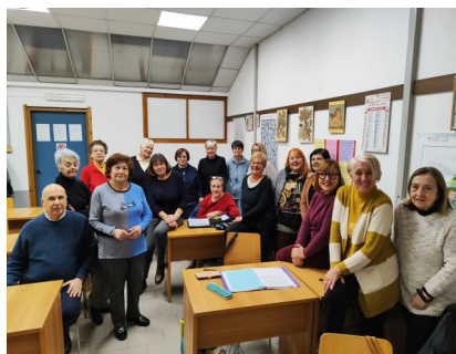
FRANCESE 3° LIVELLO