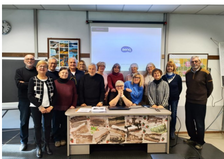
SPAGNOLO 3° LIVELLO