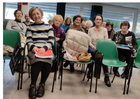
SPAGNOLO 4° LIVELLO