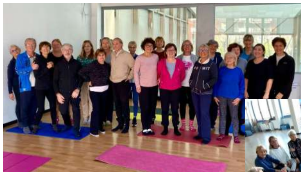
QI GONG e AUTO-SHIATSU