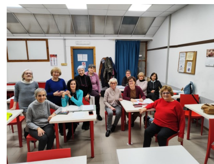
FRANCESE 4° LIVELLO